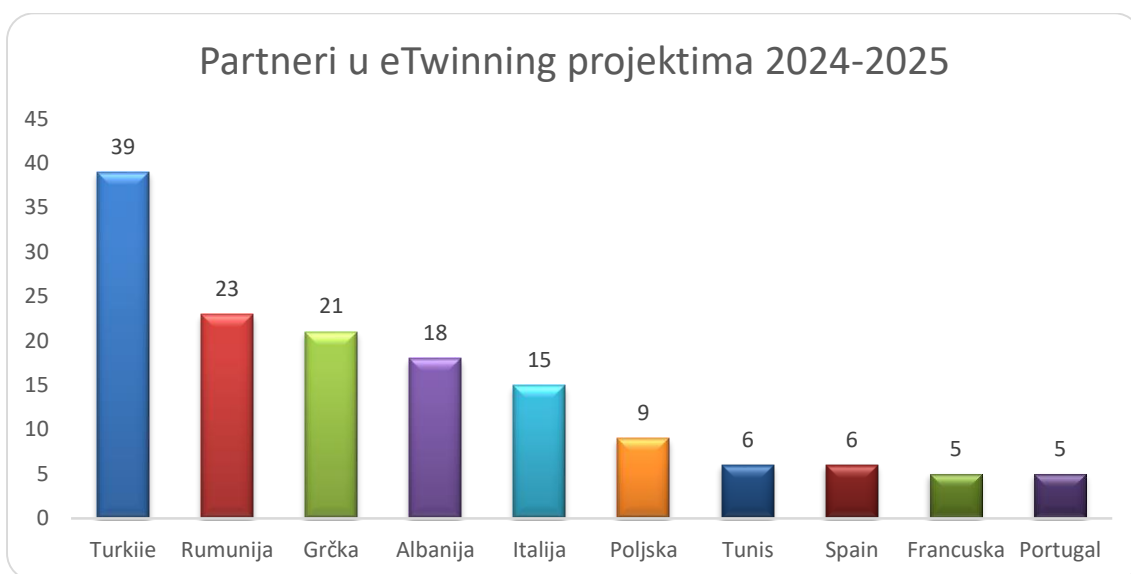
Fig. 2: Partneri na eTwinning projektu u periodu 2024-2025

U drugoj godini implementacije eTwinning-a na Kosovu, pokrenuto je ukupno 66 eTwinning projekata. Među njima, 65 projekata su bili evropski eTwinning projekti, dok je jedan projekat bio nacionalni eTwinning projekat. Kao rezultat toga, ukupno 82 eTwinning projekta pokrenuta su u periodu od januara 2024. do februara 2026. godine (videti Prilog 2 i 3).